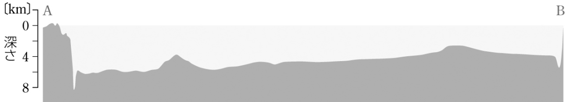
↑ 太平洋の海底地形断面図